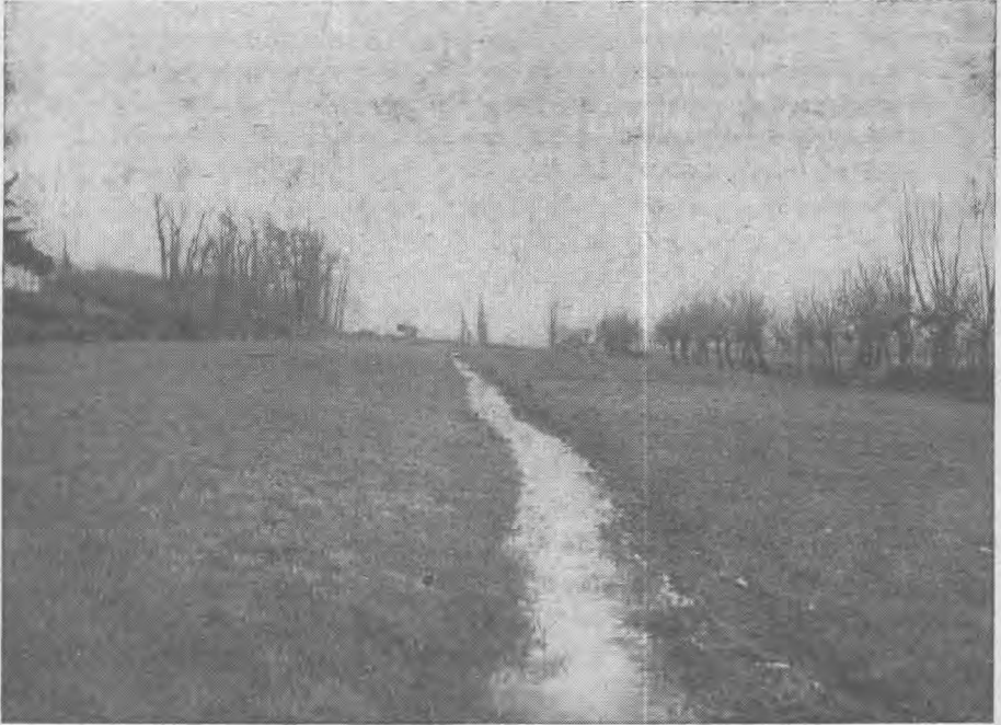
Fig. 1. — Prairie artificielle en Lombardie pendant l'hiver.

SORESI (1) auquel nous devons l'étude la plus complète sur la prairie artificielle lombarde, révèle que son origine remonte aux